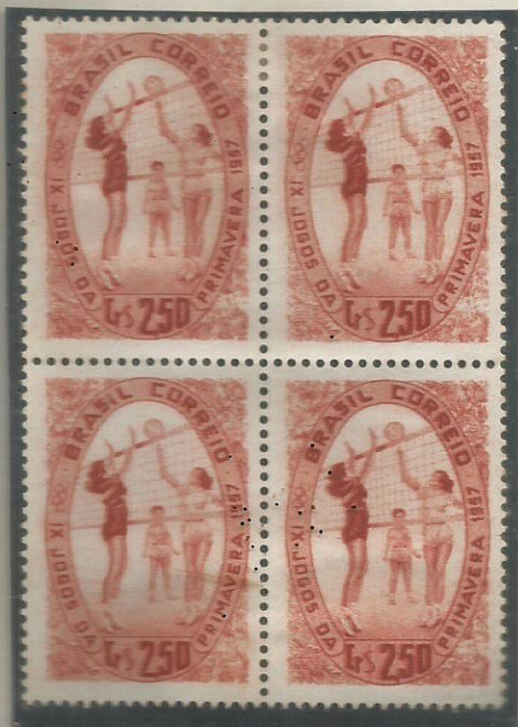
IX JOGOS DA PRIMAVERA 1957

Os Jogos da Primavera reúnem anualmente , cerca de 20.000 moças representantes de Colégios, Clubes e Entidades Educacionais