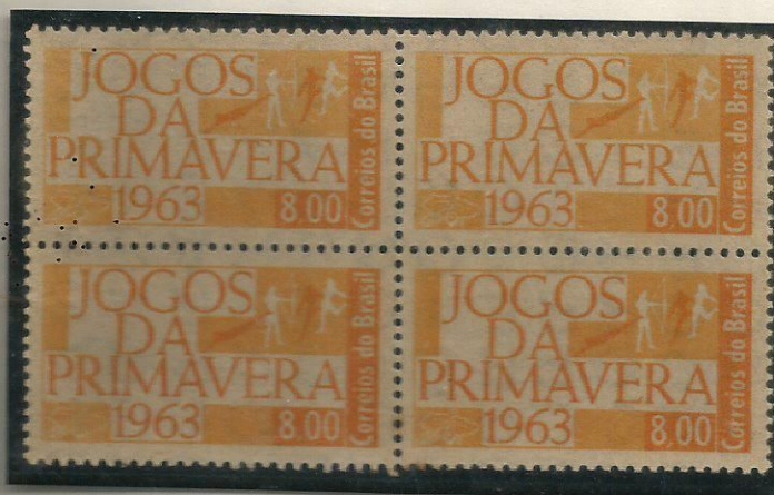
JOGOS DA PRIMAVERA 1963

Jogos da Primavera:- Espécie de Olimpíada Feminina realizada no Rio de Janeiro des de o ano de 1949 .