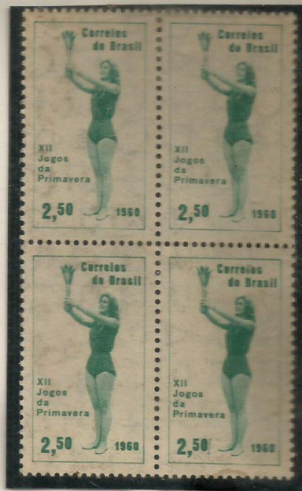
XII JOGOS DA PRIMAVERA 1960

Jogos da Primavera:- Espécie de Olimpíada Feminina realizada no Rio de Janeiro des de o ano de 1949 .