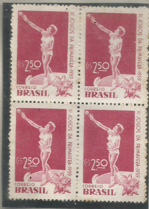
XI JOGOS DA PRIMAVERA 1959