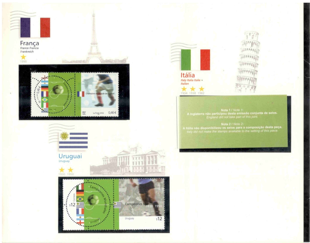
Imagem do selo da Itália que não foi vendido junto com a pasta.