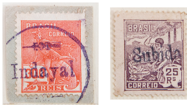
À esquerda, carimbo circular de "Indaial" com ornamentos. À direita, carimbo linear de "Subida", estação no km 63 do 1º trecho da linha.