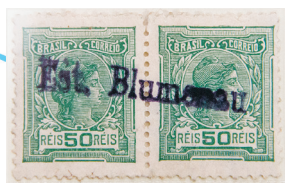
Típico carimbo linear das estações com "Est." (de Estação), com o nome da localidade. Usado entre 1918 e 1921.