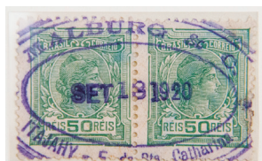
O transporte fluvial era realizado por outras empresas que também transportavam cartas e que cancelavam os selos com carimbo próprio. Caso das empresas Malburg, Asseburg e Konder.

Em 1931, o Correio instalou o "Correio Ambulante" nos trens da EFSC, quando os carimbos das estações deixaram de ser usados.