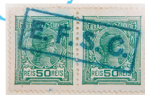
Carimbo de borracha de uso comum da E.F.S.C. em cercadura. Havia dois subtipos com diferença na altura e formato das letras.