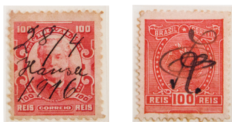
Na falta de um carimbo, ou por conveniência, os agentes das estações anulavam os selos de forma manuscrita incluindo suas próprias iniciais, como no caso à esquerda.