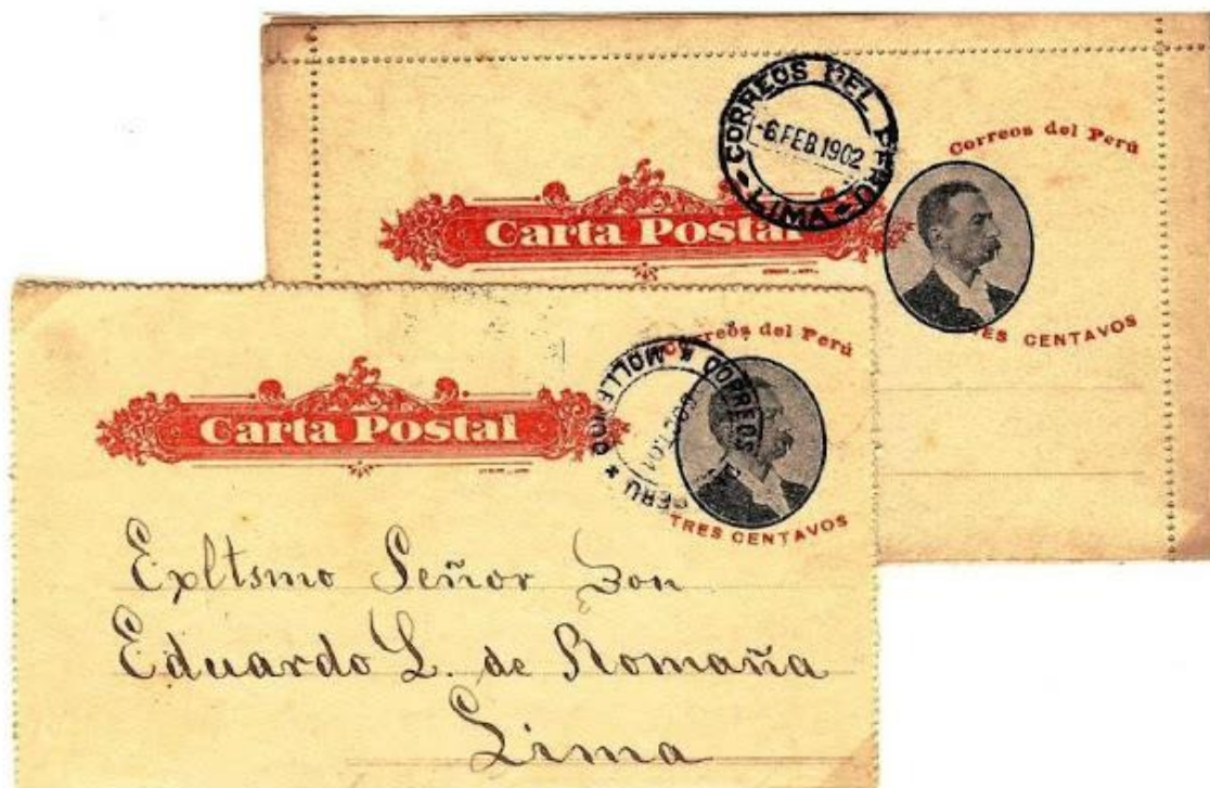
Imagen 3 Carta postal dirigida desde Molledo al Excmo. Sr. Eduardo López de Romaña y Alvizuri. En el superior, la estampación del busto está desplazada a la izquierda