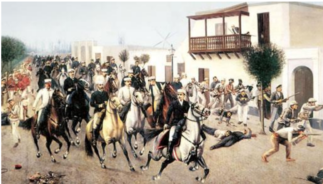
Imagen 2 Ingreso de Nicolás de Piérola en la batalla por Lima

Asimismo, los militantes del Partido Civil y el Partido Demócrata se oponían a la reelección de Cáceres y a la prolongación del predominio militar en la política peruana. De esta manera, los civilistas y demócratas hicieron un pacto histórico, que fue de gran ventaja para ambos partidos. Esto posibilitó el llamado a armas de Nicolás de Piérola (líder de los demócratas) contra Cáceres, con una amplia base popular, que produjo la llamada Revolución de 1895.