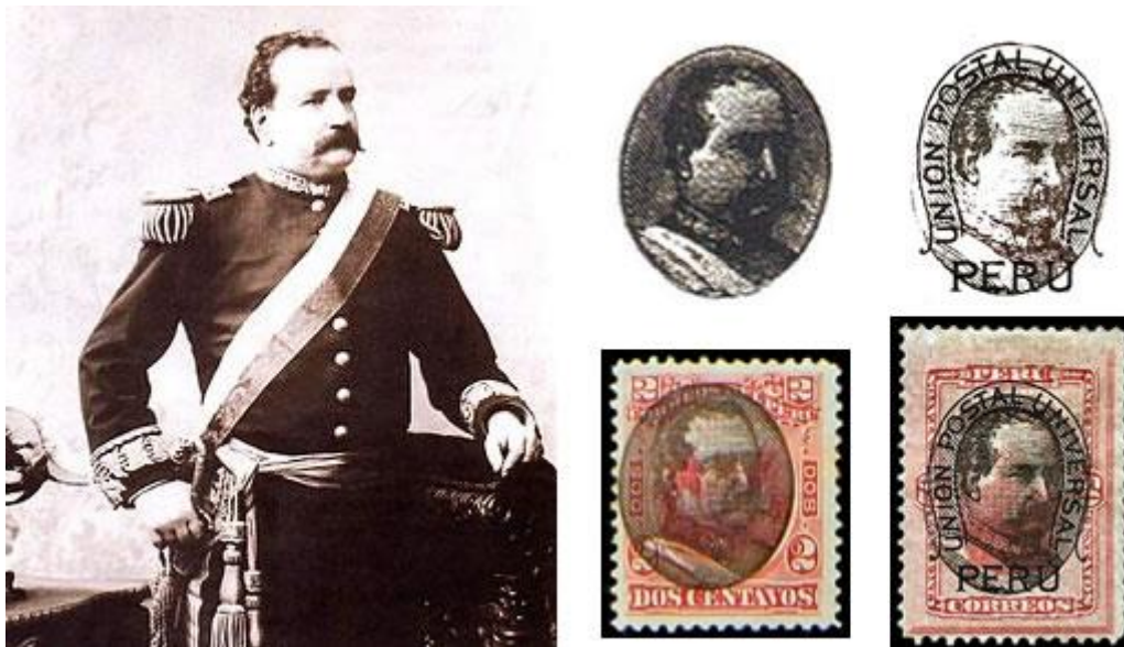
Imagen 1 - Emisión 1894 Resello en diversas estampillas de años anteriores con el busto del ex-presidente General Remigio Morales Bermúdez

El primer caso de propaganda en filatelia peruana se dio el 23 de octubre de 1894, con el lanzamiento de una serie de diversas estampillas a las cuales se les aplico un resello con el busto del recientemente fallecido (1 abril 1894) presidente Gral. Remigio Morales Bermúdez.