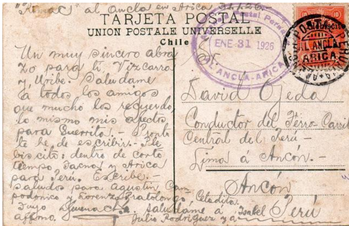
Imagen 4 - Enero 31, 1926 Tarjeta Postal Circulada de Arica a Ancón con el matasello de la oficina postal "El Ancla" ubicada en el vapor "Ucayali", donde se apostaba la representación diplomática peruana asignada para la celebración del plebiscito sobre Tacna y Arica entre el gobierno peruano y chileno.

Se estableció una oficina postal dentro del buque que permaneció por mucho tiempo anclado en el Puerto de Arica, esta Oficina se llamó "El Ancla"; así mismo se utilizaron matasellos especiales.