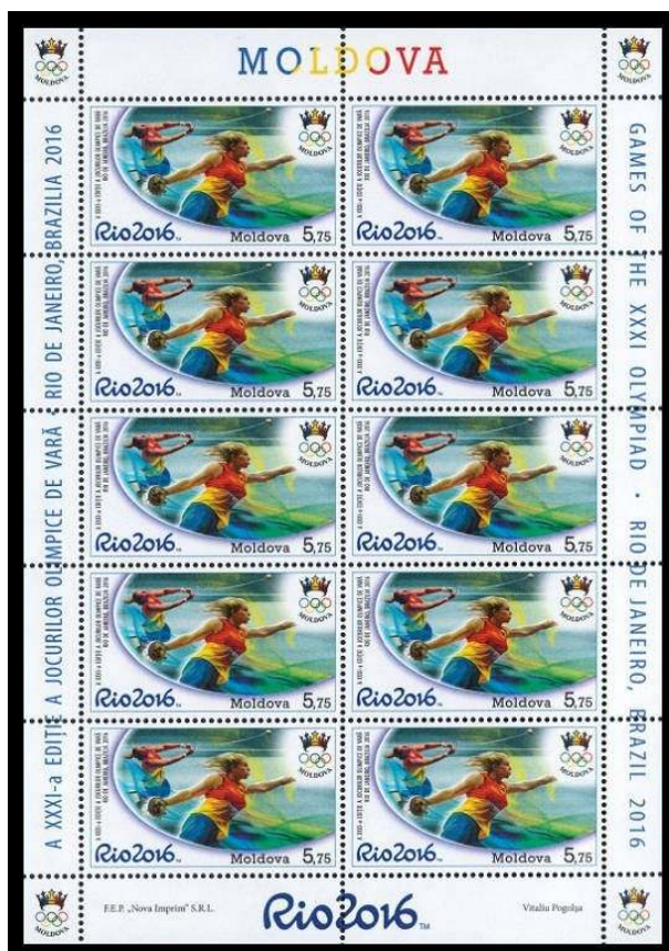
Nº 969 Kb: Impresso 14.000.

Como é habitual na Moldávia, ambos os carimbos foram impressos em pequenas folhas de 10 valores com margens decoradas. Essas pequenas folhas são uma característica especialmente interessante da filatelia da Moldávia e são particularmente procuradas pelos colecionadores.