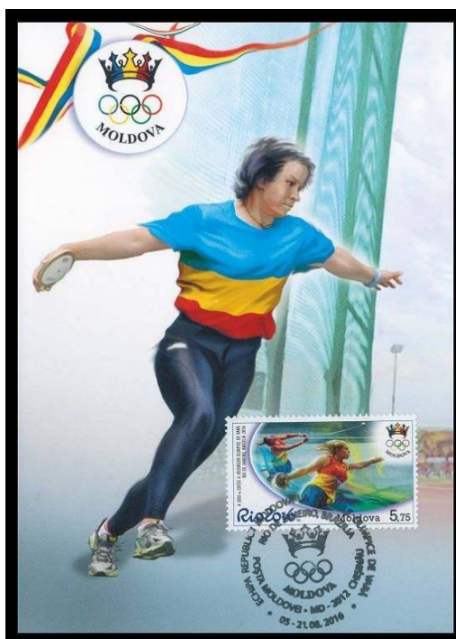
Cartões Máximos Privados Nº 969 MC1 (esquerda) e 969 MC2 (direita)