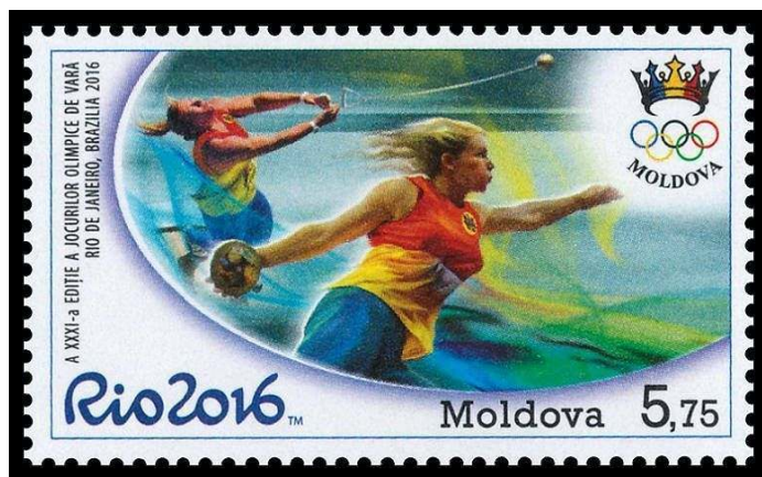
Nº 969: 5.75L Lançamento de martelo.