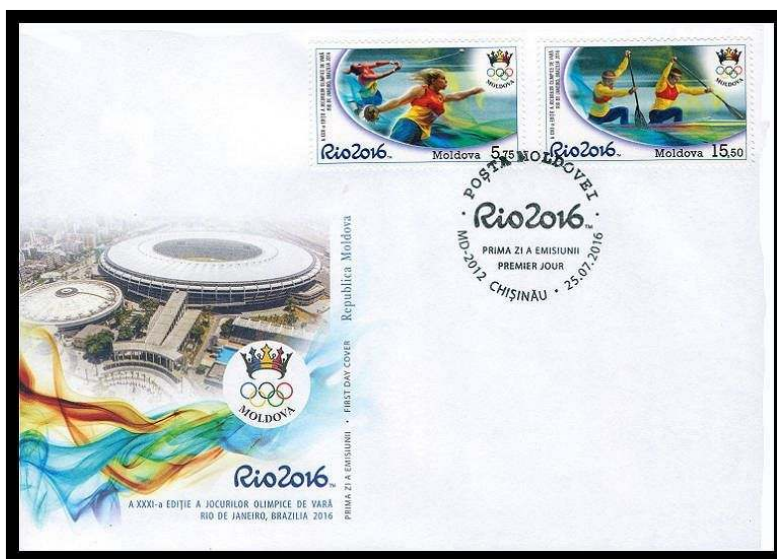
Capa oficial do primeiro dia Nº 969-970 FDC.

O carimbo oficial do primeiro dia (Nº CF347) foi datado de 25.07.2016 e emitido na principal agência postal de Chișinău, MD-2012.