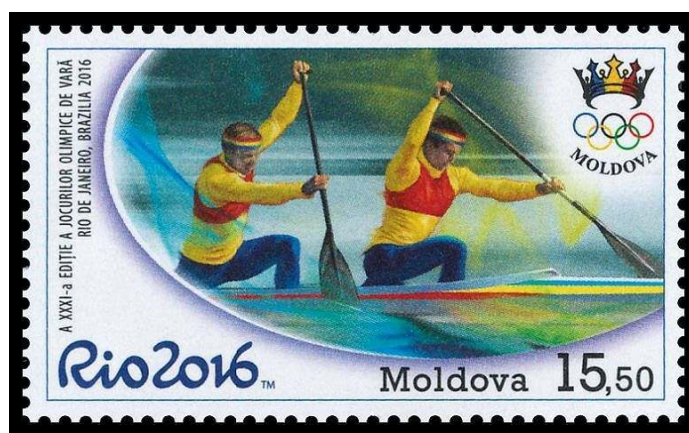
Nº 970: 15.50 Canoagem.

A série foi lançada em 25 de julho de 2016 na principal estação de correios de Chișinău, capital da Moldávia. Os desenhos de todo o material desta série foram feitos pelo conhecido artista filatélico da Moldávia, Vitaliu Pogolșa, responsável por muitas edições de selos ao longo dos anos. Os dois selos da série foram impressos pela Nova Imprim em Chișinău e perfurados 14: 14½. Ambos os selos exibiam o emblema do Comitê Olímpico Nacional da Moldávia e o logotipo oficial do Rio 2016.