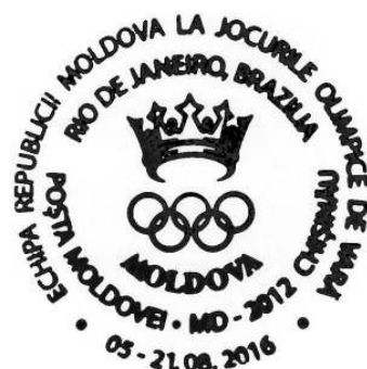
Carimbo Nº CS2016/21.

Por fim, paralelamente a este comunicado, o Correio da Moldávia imprimiu dois cartões-postais. Na Moldávia, quando esses cartões postais são impressos, os filatelistas locais têm a oportunidade de realizar cartões postais privados máximos, usando os selos oficiais e os carimbos oficiais.