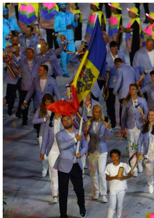
Moldávia na cerimônia de abertura dos Jogos Rio 2016.

Como foi o caso de todos os Jogos Olímpicos (verão e inverno) desde Barcelona, em 1992, a operadora postal nacional da Moldávia, Posta Moldovei, emitiu uma série de selos postais para comemorar os Jogos Rio 2016.