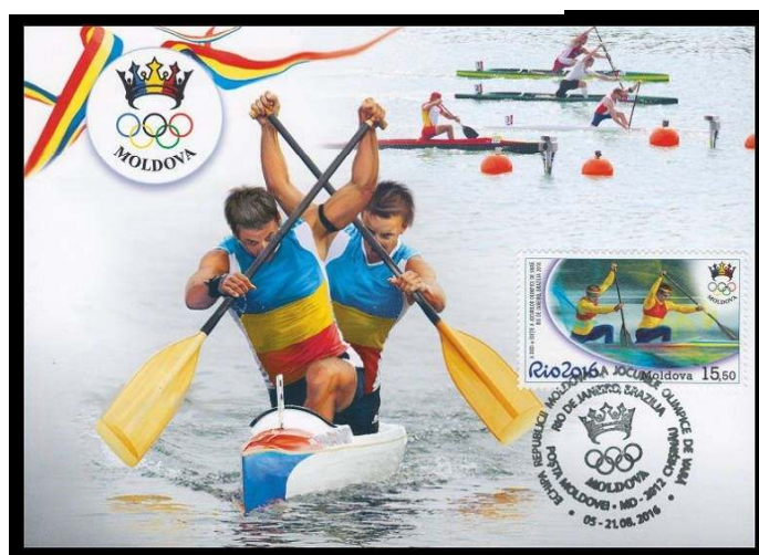
Cartões Máximos Privados Nº 970 MC1 (esquerda) e 970 MC2 (direita)

Se você quiser mais magra sobre selos da Moldávia, visite o site da IMPS em www.moldovastamps.org .