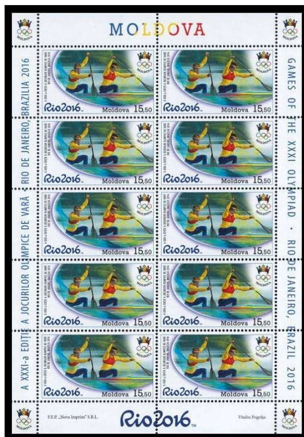
Nº 970 Kb: Impresso 6.000.

A capa oficial do primeiro dia (Nº 969-970 FDC) foi impressa em uma quantidade muito pequena de 500 peças. O cachet no envelope apresenta uma vista impressionante do famoso Estádio do Maracanã, no Rio de Janeiro, com a arena do ginásio do Maracanãzinho, à esquerda.