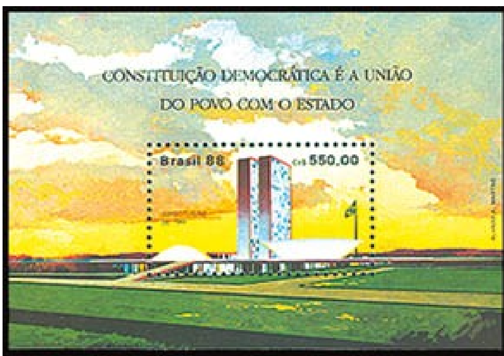
Promulgação da Constituição de 1988 – Congresso Nacional – Brasília/DF – Constituição Democrática é a União do Povo com o Estado – Emissão Postal Brasileira de 05 de outubro de 1988. Código no Catálogo RHM: B077

O prédio é um dos grandes monumentos da Praça dos Três Poderes , junto com o Palácio do Planalto e o prédio do Supremo Tribunal Federal .