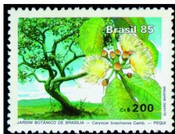
Inauguração do Jardim Botânico de Brasília/DF – Árvore e Flor do Pequi (Caryocar brasiliense Camb.) – Emissão Postal Brasileira de 08 de março de 1985. Código no Catálogo RHM: C1441

Com uma área de cerca de 5 mil hectares (sendo 90% delas dedicada exclusivamente para o cuidado e preservação da fauna e flora ), o espaço é o primeiro jardim botânico no mundo que mantém coleções de plantas em seu ambiente natural .