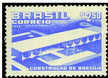
Construção de Brasília – Vista Aérea do Palácio da Alvorada (Residência do Presidente da República) – Emissão Postal Brasileira de 08 de agosto de 1958. Código no Catálogo RHM: C0418

O Palácio apresenta como destaque de sua configuração horizontal a Capela Nossa Senhora da Conceição , obra que teve um belo toque de Athos Bulcão e que lembra as casas de fazenda do Brasil Colonial .