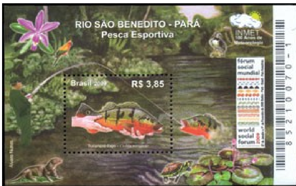
Rios Brasileiros – Rio São Benedito no Estado do Pará – Pesca Esportiva . Emissão Postal Brasileira de 27 de janeiro de 2009. Código no Catálogo RHM: B151

Com profundidade média de 2 a 3 metros , atingindo 8 metros nos pontos mais profundos , seu curso é marcado por trechos com rochas que formam cachoeiras e corredeiras , a partir dos quais surgem algumas baías, lagoas e afluentes .