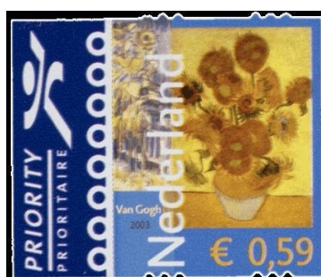
150 Anos do Nascimento de Vincent Van Gogh – Quadro “Os Girassóis” (1888). Emissão Postal Holandesa de 02 de janeiro de 2003

Apesar de ter bons hábitos de leitura , abandonou a escola logo aos 15 anos , quando passou a trabalhar em Haia como vendedor de livros , por indicação de seu tio . Depois de períodos vividos em Paris e Londres , começou a estudar Teologia em Amsterdã .