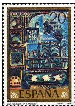
Pinturas – Pablo Ruiz Picasso – Quadro “Os Pombos” (1957). Emissão Postal Espanhola de 29 de setembro de 1978

Produziu sua primeira pintura logo aos oito anos (O Toureiro) . Já aos quatorze, seu trabalho já era muito valorizado por escolas de pintura . Mudou-se para Barcelona em 1896 depois da morte da irmã por difteria , passando a ter contato com grandes artistas catalães .