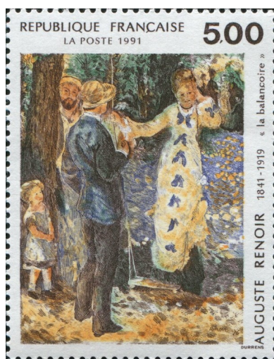
Pintura de Pierre-Auguste Renoir – “O Balanço” (1876) . Emissão Postal Francesa de 23 de fevereiro de 1991.

Mudando-se com a família para Paris logo aos quatro anos , encontrou seu caminho artístico em 1854 , quando passou a trabalhar em uma fábrica de porcelanas , decorando pratos com pinturas de flores .