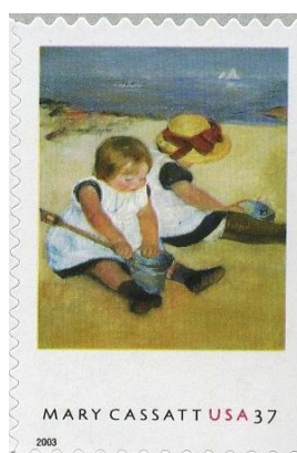
Pinturas de Mary Cassatt – Quadro “Crianças Brincando na Praia” (1884). Emissão Postal Estadunidense de 07 de agosto de 2003

Mary era bem habilidosa no bordado, música, desenho e pintura . Além disso, o longo período vivido pela família na Europa na década de 1850 lhe deu a possibilidade de visitar a Feira Mundial de Paris (1855) e conhecer artistas como Edgar Degas e Pissarro .